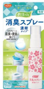
消臭スプレー 濃縮タイプ