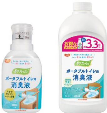
ポータブルトイレ用 消臭液