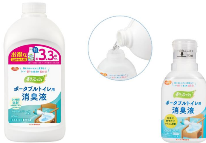
ポータブルトイレ用消臭液詰めかえ用 800ml

ピジョンタヒラ株式会社は、介護用品ブランド「ハビナース」から、お得で環境にやさしい「ポータブルトイレ用消臭液 詰めかえ用 800ml」を2022年8月22日（月）より全国にて販売開始します。