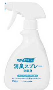
消臭スプレー 空間用 業務用