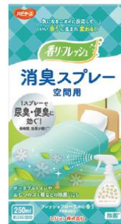
消臭スプレー 空間用